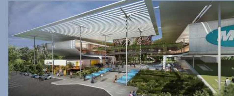
Abidjan, Costa d'Avorio

“Il vento dell'Africa subsahariana ha soffiato a favore dei nostri esportatori anche nel 2019: + 6%, dopo un 2018 che ha visto il subcontinente protagonista: +7.2%, per un valore di circa 6 miliardi, la migliore performance tra le aree geografiche mondiali” - (Fonte: Simest)