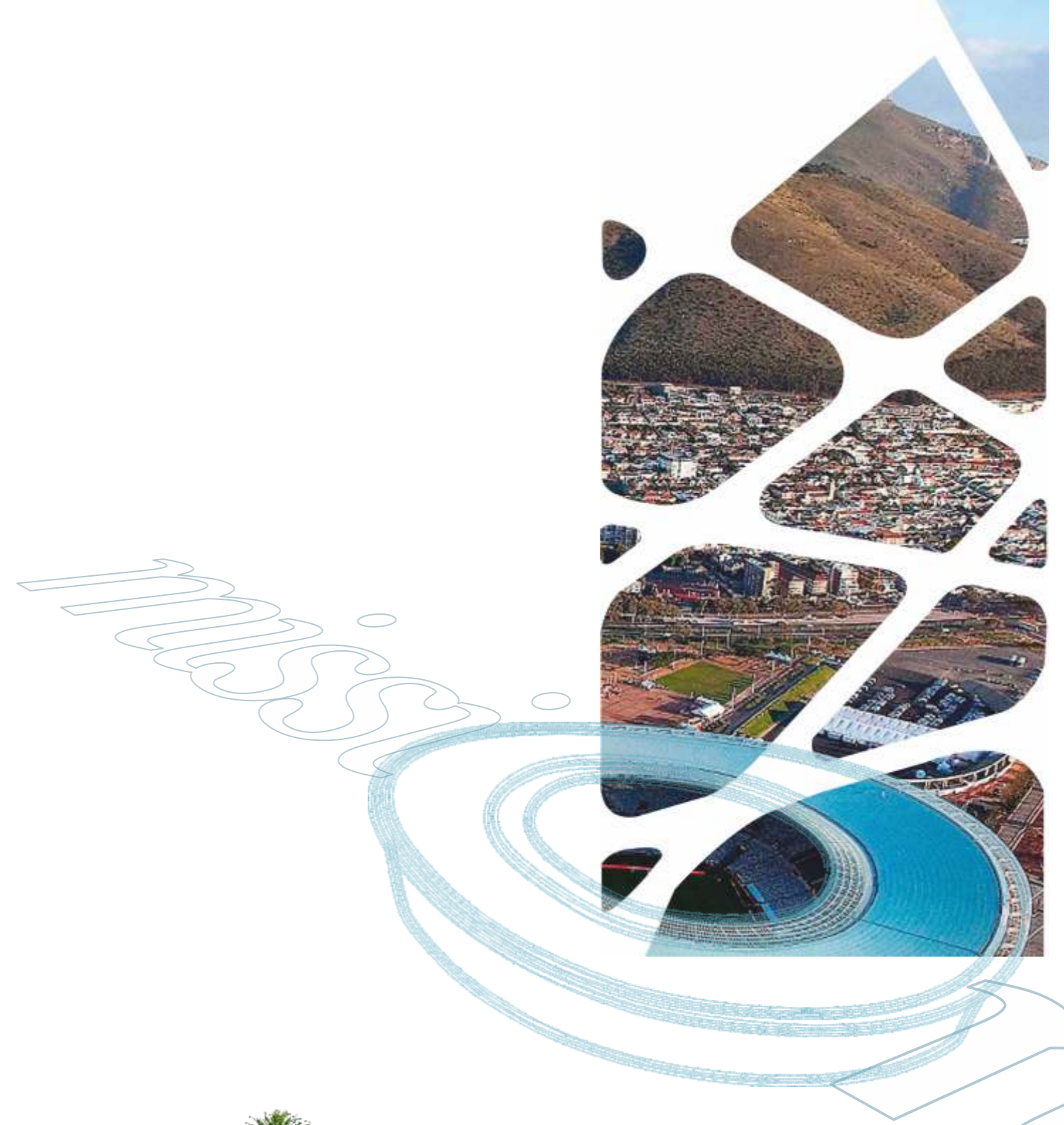
Resort in Africa

Incentivare le opportunità di business tra le Aziende italiane e gli opinion leader del continente africano, creando connessioni tra due territori ricchi di storia e di cultura. Rafforzare i rapporti attraverso scambi commerciali, soprattutto attraverso idee.