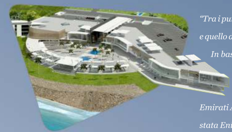
Saota Dakar SeaPlaza, Senegal

Un evento progettato e sviluppato sulle esigenze delle Aziende e sull'interesse di buyer e decision maker africani.